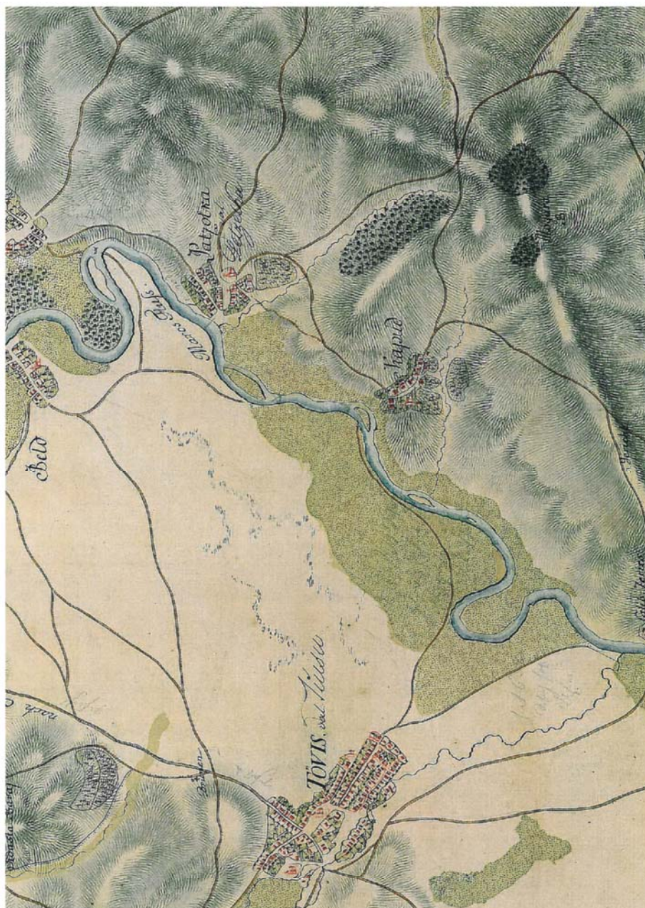
Zona Teiuşului cu satele învecinate reprezentate în „Josephinische Aufnahme” (realizată între 1763-1785) / The Teius area with the neighbouring villages represented in the "Josephinische Aufnahme" (conducted between 1763 -1785) / La région de Teius avec les villages limitrophes représentés dans la "Josephinische Aufnahme" (élaborée pendant la période 1763-1785) / Das Gebiet Teiuş mit seinen benachbarten Dörfern dargestellt in der „Josephinische Aufnahme" (dargestellt zwischen den Jahren 1763-1785) / Tövis térség a szomszéd falvakkal képviselve a „Josephinische Aufnahme”-en, 1763-1785-ös években készült / Het gebied rond om Teiuş met de naburige dorpen, weergegeven in de "Josephinische Aufnahme" (opgesteld tussen 1763-1785)